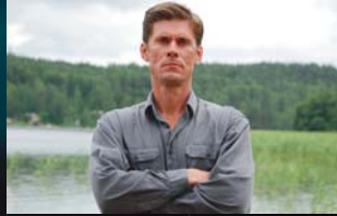
Olavi Harjula (Tommi Korpela, s. 23.8.1968)