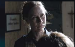
Tyynne (Kati Outinen, s. 17.8. 1961)