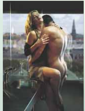
Julistekuva uudella taustalla