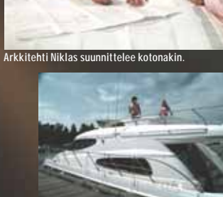
Aleksin huvineessä käy naisvieraita.