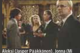
Aleksi (Jasper Pääkkönen), Jonna (Mi Grönlund), Niklas (Nicke Lignell) ja Herman (Jukka Puotila) gaalajuhlissa.