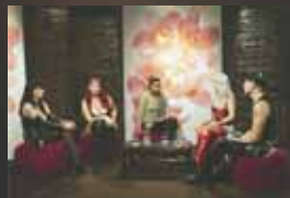
Noran tv-show hätkähdyttää ja kiihdyttää katsojia.